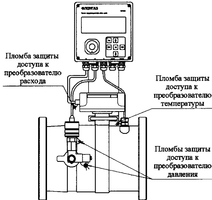
Рисунок 2 – Схема пломбировки комплекса

Электрические и пневматические линии соединений функциональных блоков комплекса со средствами измерений опломбированы согласно конструкторской документации предприятия-изготовителя таким образом, чтобы исключить возможность их вскрытия без нарушения пломб.